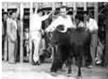
Aficionados en plena faena. La afluencia de público era muy numerosa.