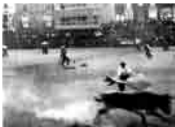
Los primeros festejos taurinos se celebraron en la Plaza Mayor.