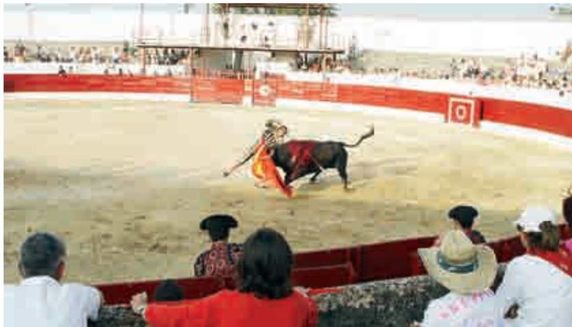
La plaza de toros de Villadiego, de 3ª categoría, tiene un aforo para 2.000 personas.

ra en los archivos del Ayuntamiento de Villadiego, el primer dato escrito encontrado en el que se menciona la celebración de corridas de toros en la villa y confirma la larga tradición taurina en esta localidad es un acta municipal de 1887. Con fecha 3 de julio de ese año se puede leer: "Así bien se acordó solicitar el competente permiso del Señor Gobernador para dar dos corridas de novillos en los días quince y diez y seis de Agosto próximo en que se celebra la función de esta Villa y se acordó que se anuncie la subasta de proveer de los novillos para dichas corridas siempre que haya lidiadores y que se anuncie la su-